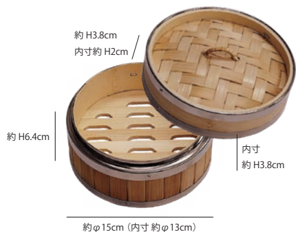
(19461) ステン枠 竹中華セイロ 蓋 φ15 1,300円 材質:竹、籐、ステンレス、アルミ