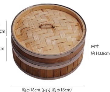
(19463) ステン枠 竹中華セイロ 蓋 φ18 1,500円 材質:竹、籐、ステンレス、アルミ