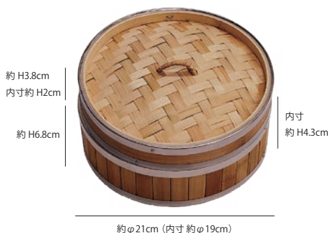
(19465) ステン枠 竹中華セイロ 蓋 φ21 1,800円 材質:竹、籐、ステンレス、アルミ

アルミ製の杭を留め具に採用。竹とステン枠をしっかりと固定。内側の枠までしっかりと固定をすることで強度を維持します。取り扱い時はご注意ください。